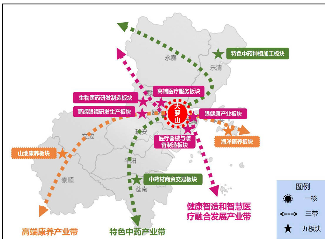
图3 温州市生命健康产业空间布局图

立足温州市生命健康产业资源分布情况，结合全市“一区一廊一会一室”布局导向以及未来生命健康产业战略方向，按照“全域规划、资源统筹、特色突出、功能联动”的原则，构建“一核三带九板块”的生命健康产业整体空间布局，并通过“一核引领、三带联动、九板块支撑”，打造温州生命健康产业未来发展新空间。